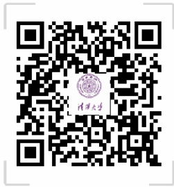
中国公共管理案例中心

（一）请关注中国公共管理案例中心网站、微信公众号和赛事交流QQ群，获取最新信息。